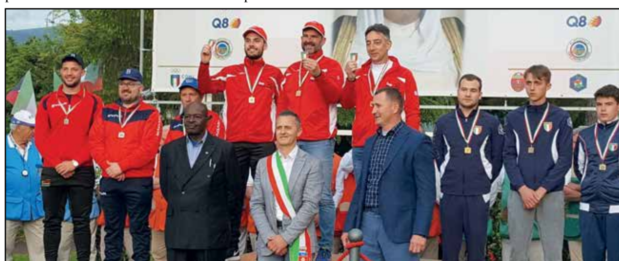
I vincitori sul gradino più alto.