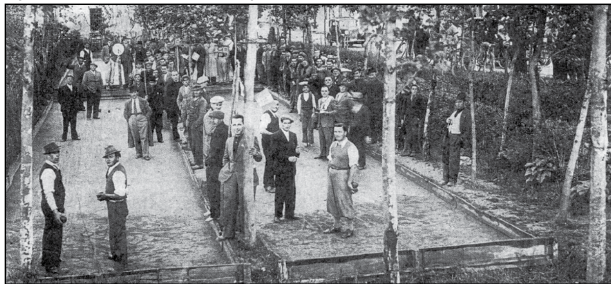
Gara di bocce in Borgosotto.

molto appassionati che assistono alla gara. Tutti rivolti verso il fotografo per essere immortalati, e diversi di loro si possono riconoscere.