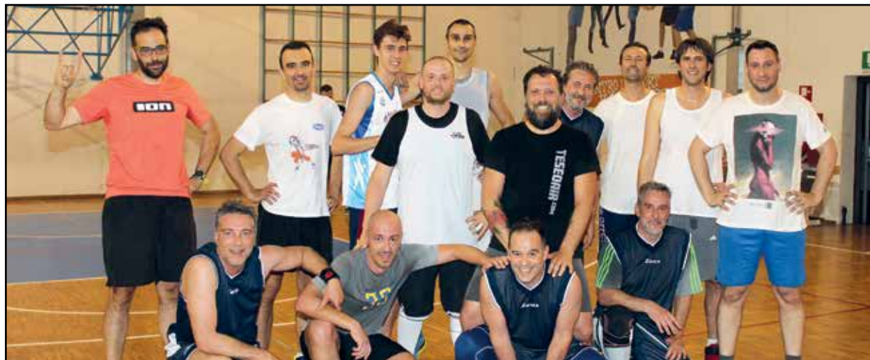
Gli amici giocatori "distrutti" a fine partita terminata in parità.