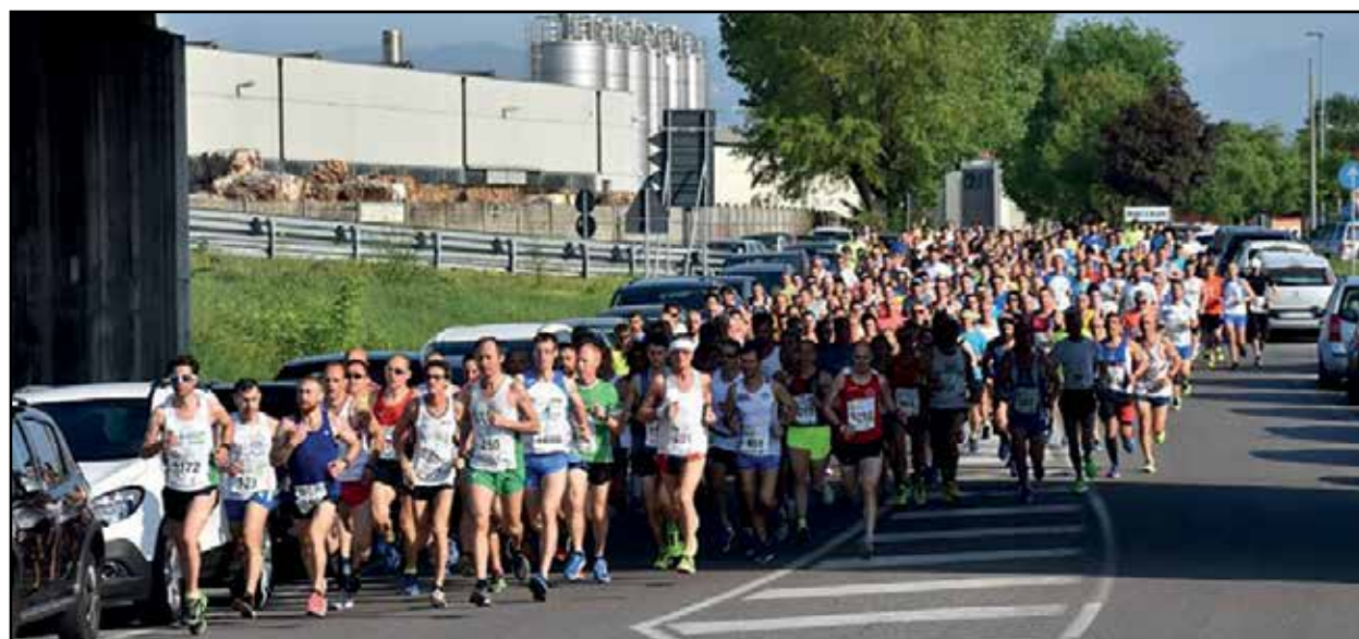
Partenza di numerosi partecipanti alla storica corsa a piedi per le vie di Montichiari.