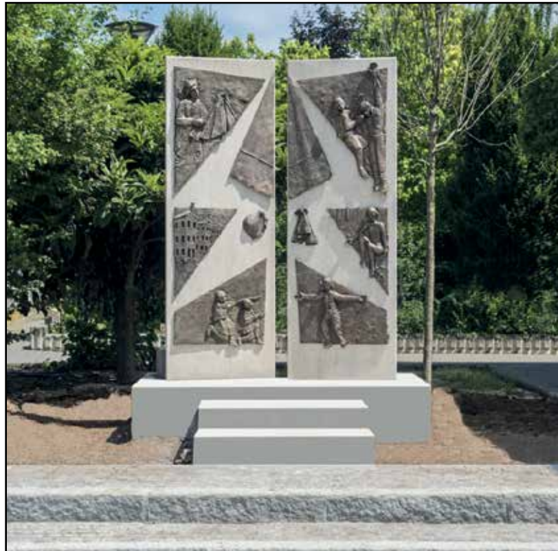
Il monumento realizzato dallo scultore monteclarense Dino Coffani.

Ci sarà, poi, la vera e propria inaugurazione del monumento, con disvelazione dell'opera, accompagnata dall'alzabandiera, inno di Mameli e benedizione.