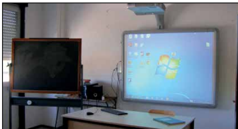
Dall'antico al moderno passaggio delle consegne.

Le maestre della scuola primaria Chiarini