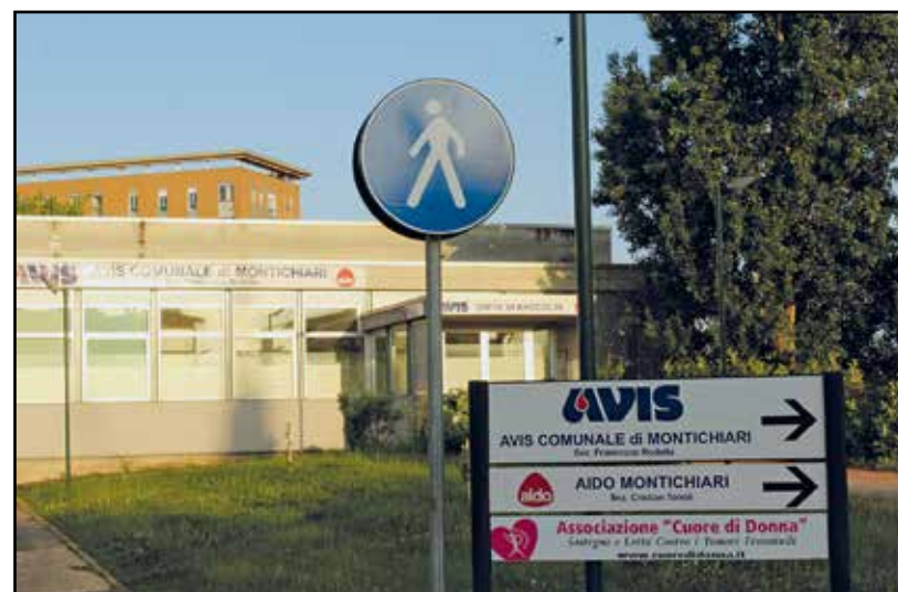
La palazzina d'ingresso dell'ospedale.